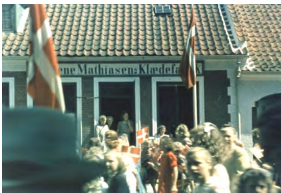
Byfesten i 1945