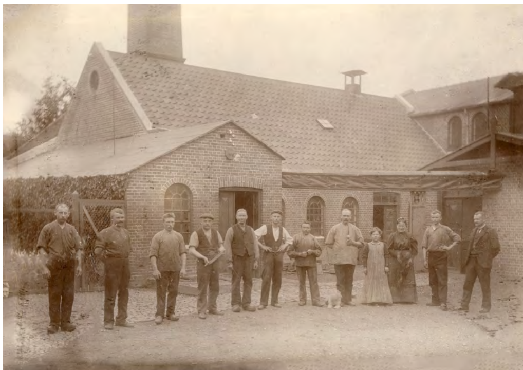
Personalet år 1900

Det var for størsteparten behandling af hjemmevævet tøj der skulle ”stampes” eller i fagsproget ”valkes” sådan, at det blev fjertæt, bl.a. til dynevår. Meget garn blev også indleveret til farvning og desuden havde man en del år ret betydelig garderobefarveri.