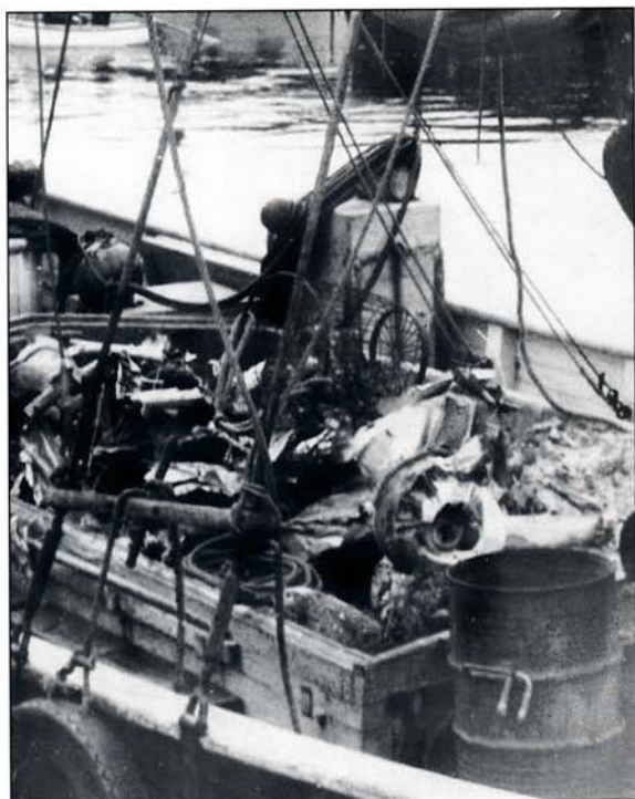
De sørgelige rester af den engelske jager, der faldt ned ved Livø 5.marts 1945. I Løgstør havn.