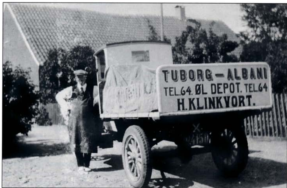
Klinkvort havde øldepot i baghuset. Her er bilen, model 1921, klar til at køre ud til Grønnegade på vej til byens 25 købmænd.

Vridemaskinen var skruet fast på baljen med det blå vand, og ét for ét tog vaskekonen det våde tøj op, og klemte en flig ind mellem de to hvide gummiruller på vridemaskinen, som jeg trak med begge hænder på håndsvinget. Det vredne tøj, som nu ikke dryppede, blev ét for ét lagt i en kurv.