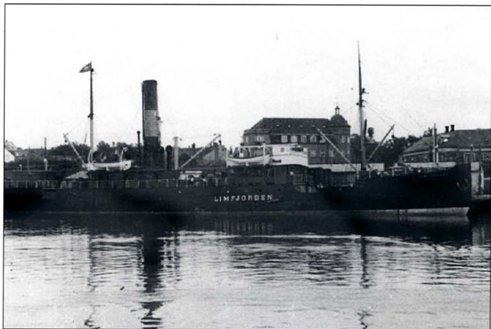
Her ses »Limfjorden« lige inden det hele var slut i begyndelsen af 1950'erne. De seneste år var skibet beskæftiget med sejllads mellem Polen og Sverige med anløb af København. Det var også omkring Løgstør, da der blev solgt levende heste til Polen i 1948. De blev sejlet ned af "Løgstør-skibet".

Krigen betød - i mellem alle mulige andre omlægninger - også ændringer i rutesejladsen på Limfjorden. Det var faren for minesprængning, og en væsentlig nedgang i godsmængden, der gav anledning til et skift til mindre skibe og skibe af træ. Allerede i 1940 blev den nybyggede galease »Jens Juhl«, der blev bygget i Nykøbing Mors, taget ind på charter for at betjene Den vestlige Limfjord. Senere i 1943 blev coasteren »Sundet I«, der senere fik navnet »Bogø«, indsat på Limfjorden. Helt præcis