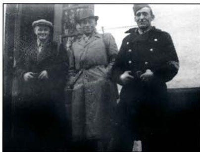
Tre frihedskæmpere med Bjerrehus fra Ranum i midten. Foran politistationen.