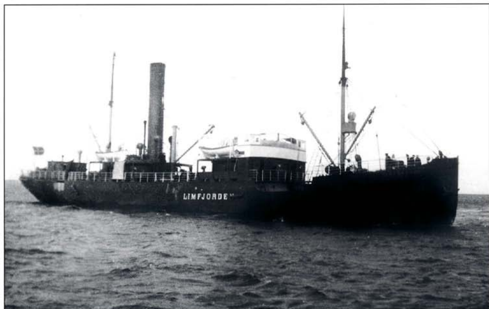
Sådan så »Limfjorden« ud i langt de fleste af de år, da skibet sejlede mellem København og Limfjorden incl. Løgstør. Skibet blev i 1913 forlænget af byggeværftet, der indbyggede en sektion med lastrum mellem brohuset og skorstenen med maskinrummet under dæk. Billedet her er taget af Arnold Hagstrup under et anløb af Struer, der var skibets sidste station i fjorden. Det anløb desuden Nykøbing Mors, Thisted og Løgstør

Sejladsen til og fra Løgstør skete i begyndelsen af ugen, da skibet kom fra København (ofte tirsdag morgen). Returrejserne skete lørdag/søndag. Skibet afsejlede fra søndag formiddag til Aalborg - og var i øvrigt brugt som rutebåd til Aalborg - og