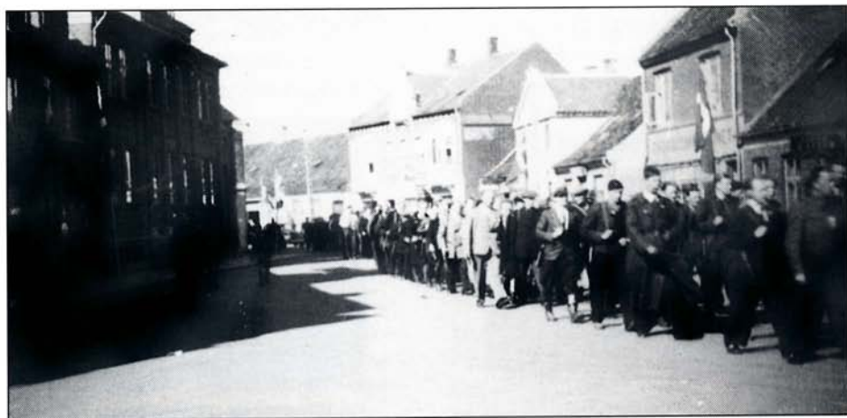
Frihedskæmperne på march gennem Østerbrogade 8. maj.