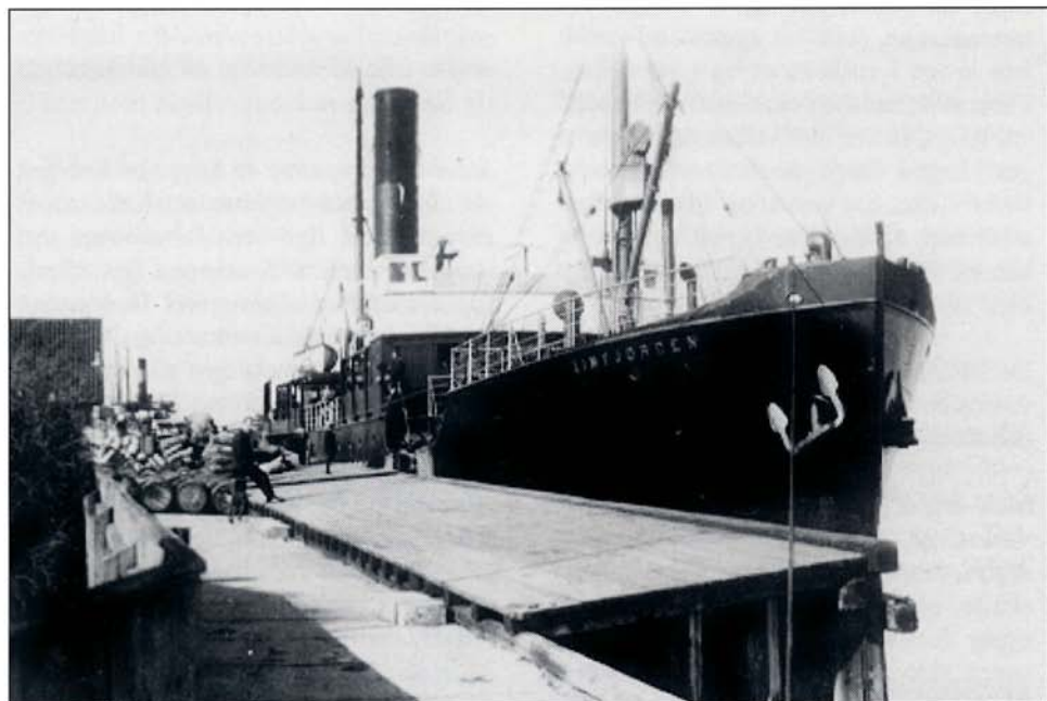
Her ses »Limfjorden« ved dampskibskojen i Løgstør i et af de første år, som skibet var i drift. Det var inden det blev forlænget i 1913. Træbroen blev taget ned i vinteren 1976/77.