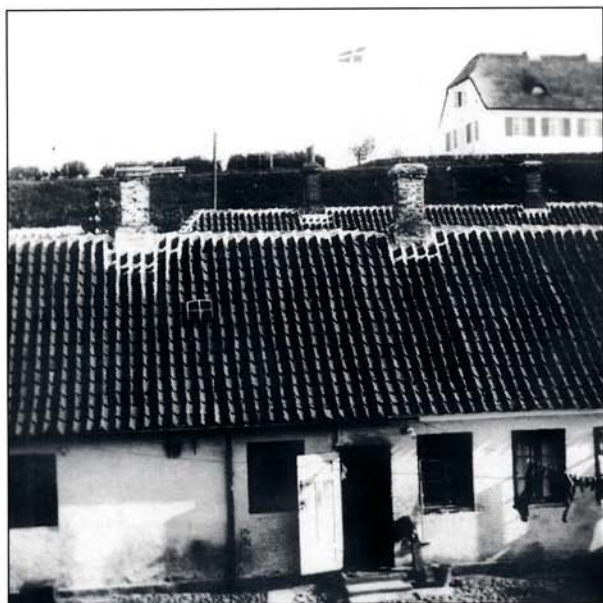
Bagsiden af Klinkvorts hus. Butikken var ude til venstre.

og li'som sugede kaffen igennem. Hun holdt på en flot måde, syntes jeg, underk o p p e n balancerende på sine fem strakte fingre. Jeg kiggede lidt misundeligt på, for jeg vidste godt, at jeg ikke måtte hælde min mælk i underkoppen, når jeg fik morgenmads- eller