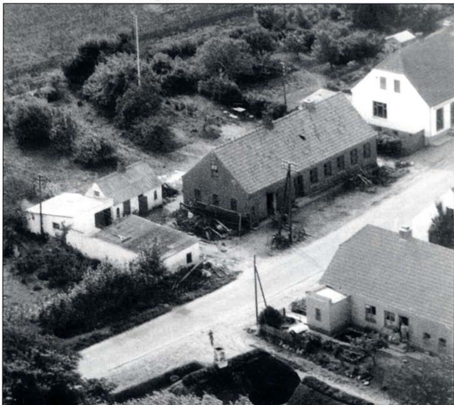
Smedien i Brøndum, ca. 1950.