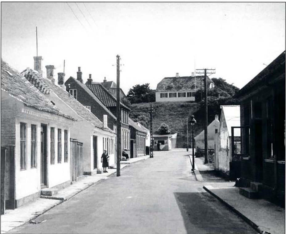
Det var nok i Grønnegade, at Kruuse talte med den gamle mand.

Snakken gaar ganske langsomt, en Samtalens Kedel, som smaasnurrer. Han har ikke noget at beklage sig over. - Der er nogen, der ikke kan forstaa, hvad man saadan kan sidde og tænke paa i min Alder. Men jeg siger nu, at der er nok, gør jeg.