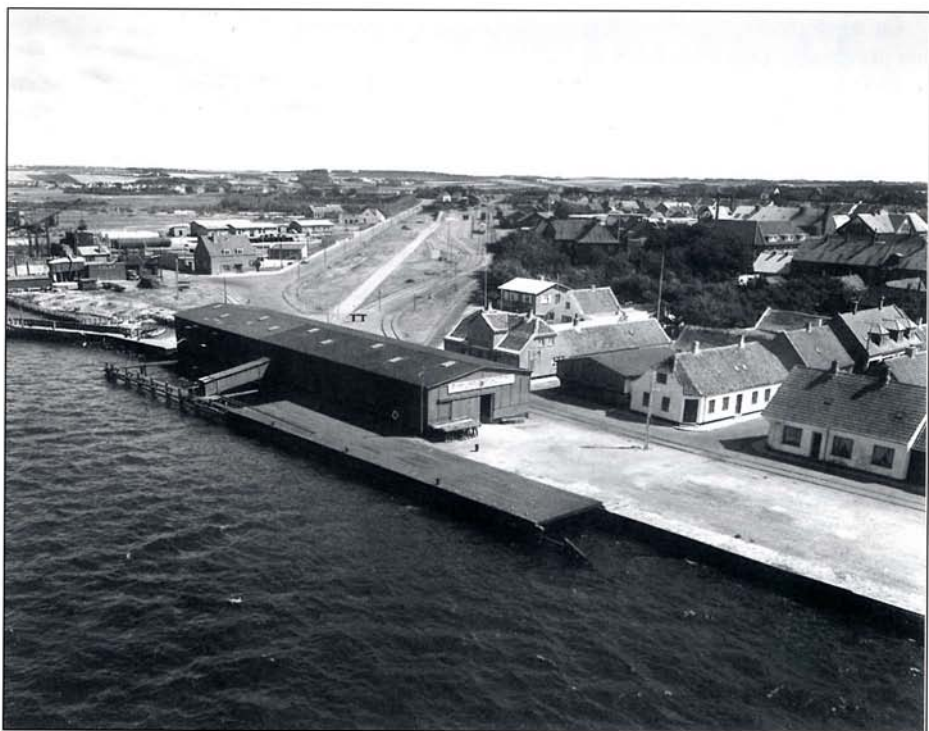
Det røde pakhús 9.juli 1956

hus" og det gamle færgeleje (Østre mole). Her har jeg taget mange "køwenhavner" og ikke mindst bundbid - disse oplevelser i barndommen har siden holdt mig langt væk fra enhver form for lystfiskeri.