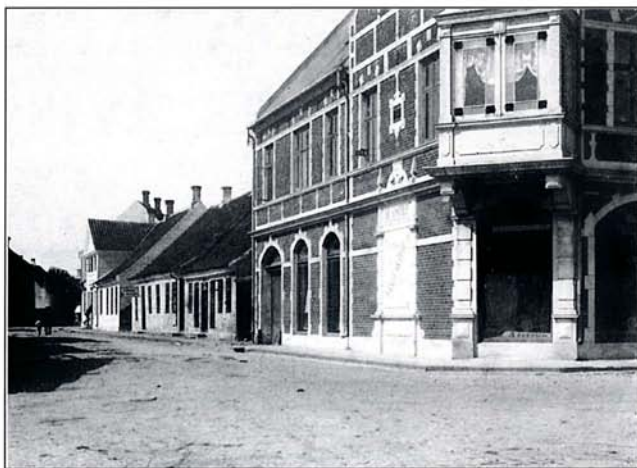
Vi har desværre ikke et billede af huset, da det var helt nybygget. Dette billede er nok fra ca. 1895.

Aistrup havde etableret sig i 1865 i en nybygget ejendom på hjørnet af Torvegade og Fredensgade, men først i 1870-erne var han flyttet til et mindre hus på hjørnet af Torvegade og Østerbrogade. Da han købte huset i 1875, kom han af med 12.000 kr.