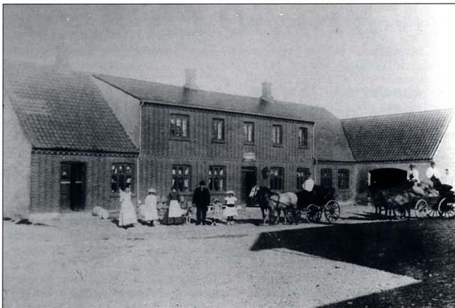
Vindblæs kro i den første tid med tømmerhandel og købmandsbutik.