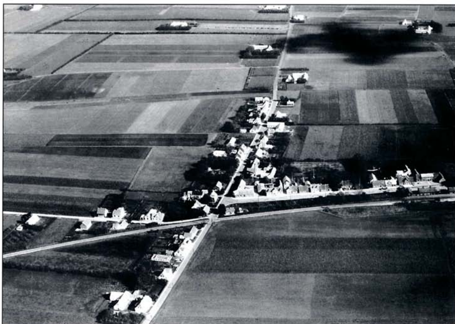
Udsigt over Vindblæs 1947. Banen ses i forgrunden, og kroen og Stationen ude til højre.