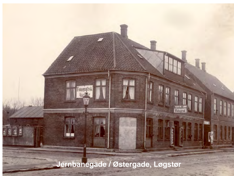
Jernbanegade / Østergade, Løgstør