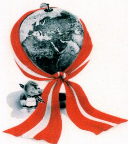
Fra 25-års jubilæet med Mulle "under jorden"