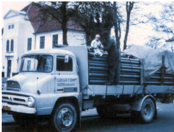
Thames Trader i Rådhusgade 1965 eller 64