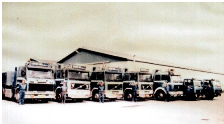
Vognparken til transport primært i Skandinavien og Schleswig - Holstein var et transportfirma værdigt

givet på mere end en halv snes sprog, nemlig de fleste europæiske, men også russisk og kinesisk, ligesom en række forhandlere selv lod materialet oversætte til eget sprog.