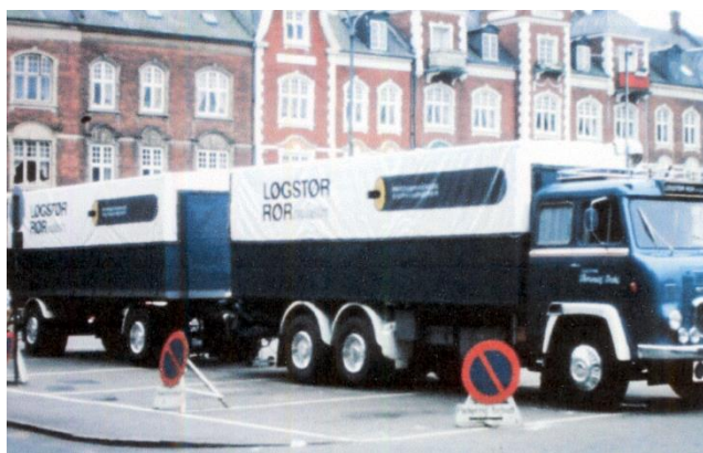
Scania Vabis vogntog ved en messe i Fredericia

Men også personligt forstod Kobbersmeden værdien af positiv omtale, som fx da han ved en velgørenhedsauktion købte H.M. Kong Frederik d. 9's slips for 800 kroner. Dyrt slips, men en billig, sober og landsdækkende reklame. Slipset blev aldrig brugt siden.