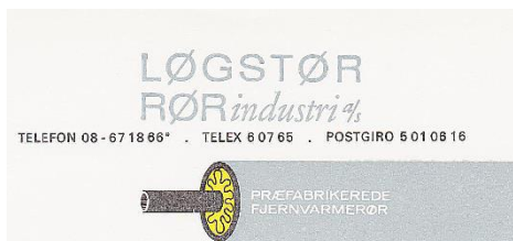
Logo på brevoved

om de nye muligheder og begyndte at købe rør hos A. Andersens Enke, som var familiens blikkenslager- og installationsfirma. Men hurtigt kom LØGSTØR RØRindustri til. I løbet af kort tid gik historien om de nye produkter i branchen, og mindre og større kommunale værker som fx mange mindre private værker