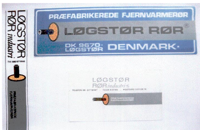
Logo på plastomslag og aluminiumsetiket på rør

stede i slutningen af 1950’erne, fik Kobbersmeden fra Løgstør sammen med familie og medarbejdere, held med sine eksperimenter og fremstillede verdens første PRÆFABRIKEREDE FJERNVARMERØR. De første rør blev, helt naturligt, brugt i Løgstør, men installationskolleger i bl.a. Fjerritslev og Aalestrup lærte hurtigt