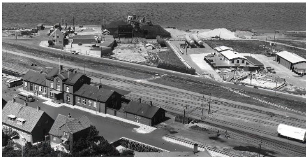
Gasdepoterne i 1957 med fundament til ny administrationsbygning med lejligheder til Dalsø Gas

Ca. 1/3 del valgte elkomfurer. Resten valgte flaskegas.